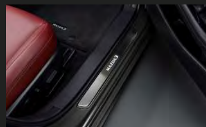
門檻飾板 (4 門 ; 前 LED 燈)