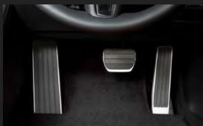
腳踏套裝飾 (自動波)