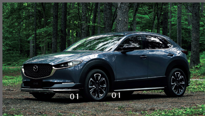
01. 前下 / 車側 / 後下擾流